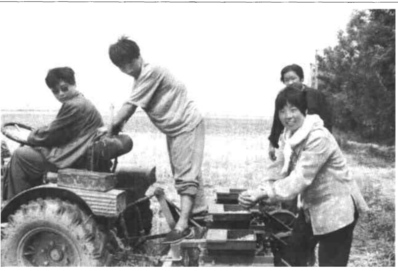
广饶县大码头乡党委、政府针对当前良好的墒情，组织农民全力以赴上阵，一手抓夏收，一手抓夏播，确保增产增收。图为农民们正在进行玉米播种。

围绕棉花这一产业，利津县供销社重点做了三项工作。一是逐步完善良种繁育体系。在县社统一组织下，先后与山东农业大学、河北冀岱种子子公司、山东省农科院等单位联合，以专业合作社的形式组织农民开展良种繁育。2000年与山农大联合繁育山农丰抗6号新品种；2001年与河北冀岱种子子公司联合繁育99B优系新品种，由于其产量、品质和抗性均有明显的优势，两个品种被列为县政府重点推介品种。